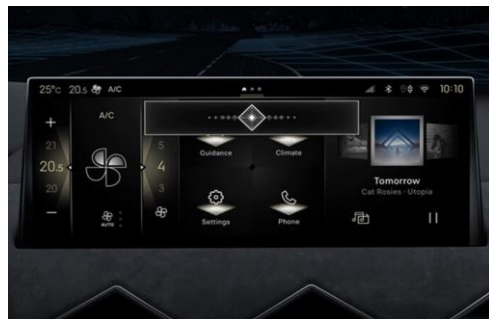
Σύστημα DS IRIS