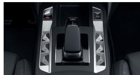
Χρωμιωμένο διακοσμητικό μοτίβο guilloche «Clous de Paris» στο κιβώτιο ταχυτήτων