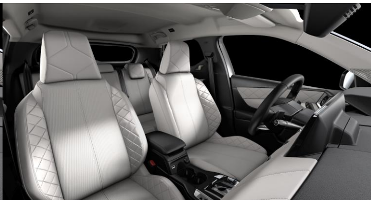
Επένδυση καθισμάτων σε δέρμα Nappa Gris Galet & ύφασμα Luxembourg