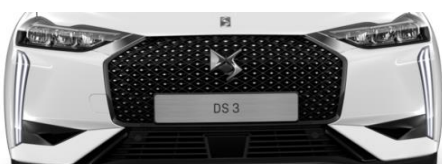
Μάσκα οχήματος σε μαύρο με διακοσμητικές λεπτομέρειες