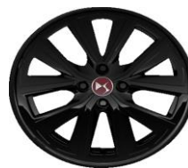
Ζάντες αλουμινίου 17" OSLO