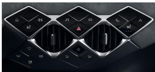
Κεντρικό πάνελ χειρισμού, με πλήκτρα αφής