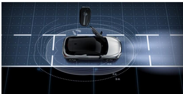
Σύστημα εισόδου & εκκίνησης χωρίς κλειδί