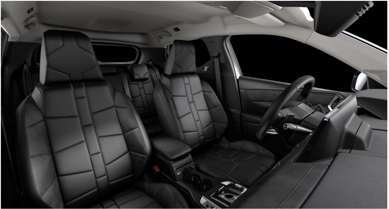
Επένδυση καθισμάτων σε δέρμα Nappa σε σχεδιαστικό μοτίβο Bracelet και ραφές σε σχήμα μαργαριταριού

Ζάντες αλουμινίου 18" NICE, σε μαύρο Onyx (diamond cut), με ελαστικά 215/55 R18 99V - φ 690mm