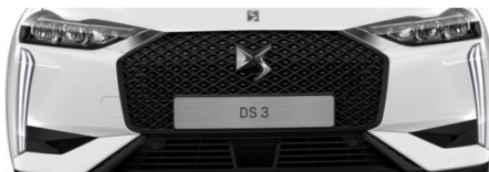
Μάσκα οχήματος σε μαύρο ματ (PureTech 100)