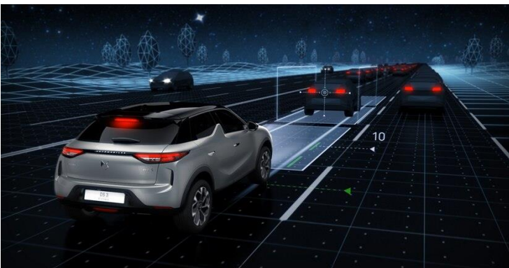
Σύστημα DS Drive Assist (Περιλαμβάνει Adaptive Cruise Control Stop & Go και Lane Positioning Assist)

Ο βασικός εξοπλισμός μπορεί να μεταβληθεί λόγω ανάγκης κατασκευαστικού ή εμπορικού χαρακτήρα χωρίς καμία προειδοποίηση