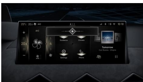
Σύστημα DS IRIS