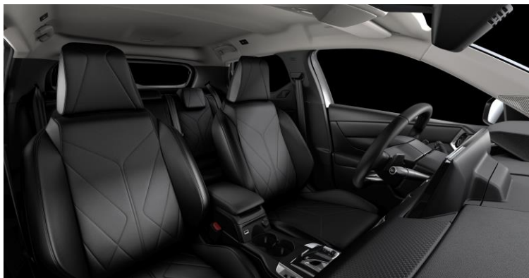
Επένδυση καθισμάτων σε δέρμα Black Basalt