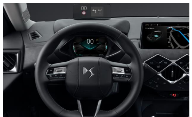
Έγχρωμη οθόνη πίνακα οργάνων 7" και έγχρωμο Head Up Display

Ο βασικός εξοπλισμός μπορεί να μεταβληθεί λόγω ανάγκης κατασκευαστικού ή εμπορικού χαρακτήρα χωρίς καμία προειδοποίηση