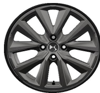
Ζάντες αλουμινίου 17" GLASGOW