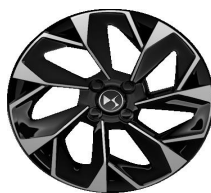
Ζάντες αλουμινίου 18" NICE